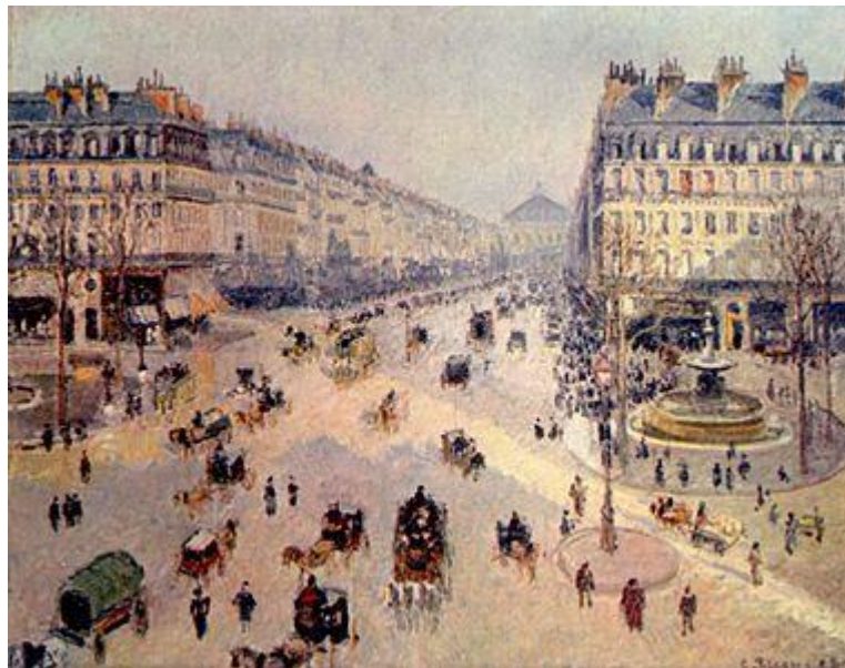
Camille Pissarro 1830-1903 L'avenue de L'opéra Huile sur toile 73 x 91,8 cm

L'avenue, peinte par Camille Pissarro en 1898