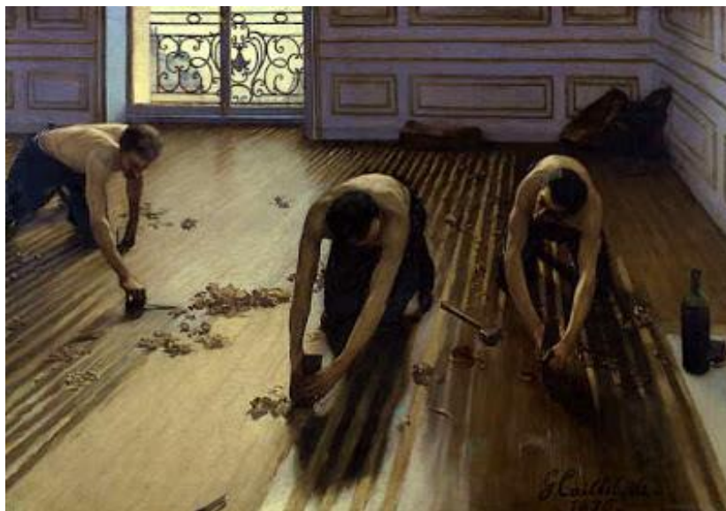
Gustave Caillebotte (1848-1894) Les raboteurs de parquet 1875 Huile sur toile H. 102 ; L. 146,5 cm Paris, musée d'Orsay Don des héritiers Caillebotte par l'intermédiaire d'Auguste Renoir

Le Musée d'Orsay est un monument historique classé depuis 1978. C'est effectivement dans l'ancienne Gare d'Orsay que ce musée abrite depuis 1986 une collection fascinante d'oeuvres provenant entre autres, du Louvre et du Musée du Jeu de Paume... Visiter la collection impressionniste du Musée d'Orsay rejoint tout naturellement le cours d'histoire des Arts. (Le programme du cycle terminal portant sur la période allant de 1815 à nos jours). Il fut alors aisé d'associer la visite de la Galerie des Impressionnistes du musée à la thématique du cycle terminal « Patrimoines, représentations et mémoires du travail » pour réaliser une seconde lecture in situ des oeuvres étudiées en classe. Citons par exemple cette représentation du prolétariat urbain chez Gustave Caillebotte :